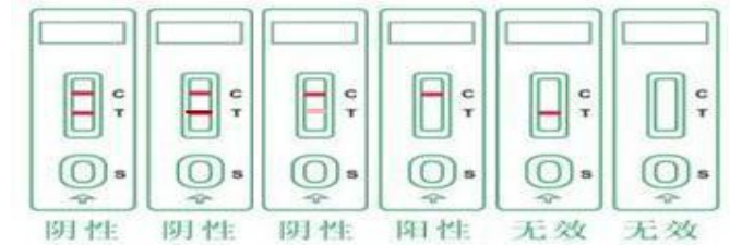
图 2 结果判定示意图

加样后开始计时，在 5min 内，用肉眼观察测试区和质控区，判断结果，其他时间判断无效。见图 2